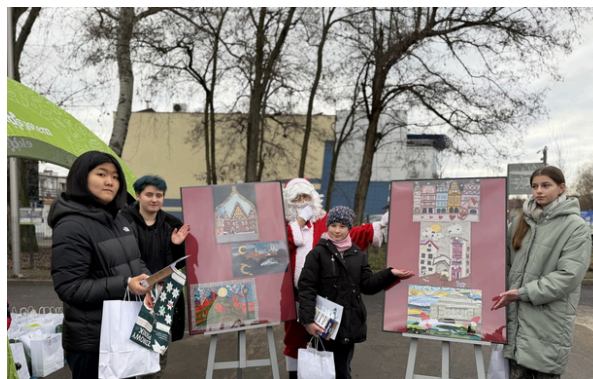
Oficjalne odsłonięcie zwycięskich prac oraz wręczenie nagród odbyło się na Zimowym Rodzinnym Ekologicznym Pikniku w PSZOK.