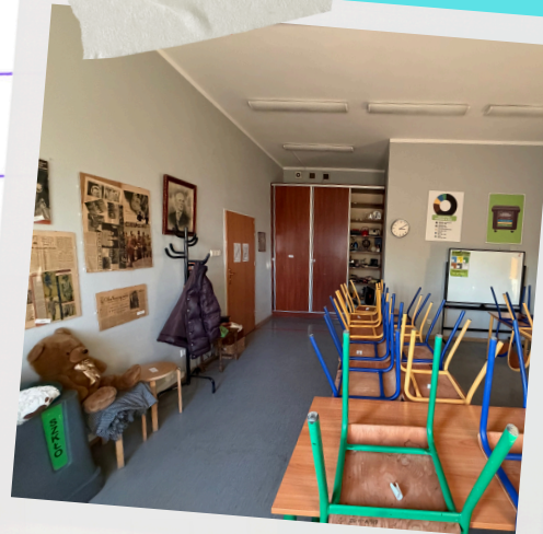
Czy wiecie, że... od stycznia 2020 r. przy ul. Michalczyka 23 działa nowa sala edukacyjna?