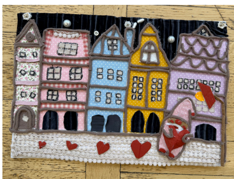
I Miejsce w kat. klasa IV-VI - Seunghwan Seo , „Nocny widok rynku”

Partnerem merytorycznym konkursu był MDK Fabryczna.